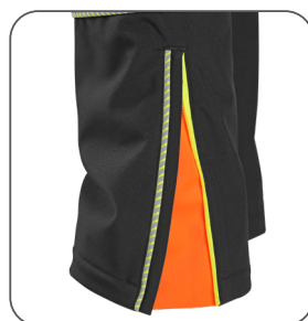
zip na nohavicích zipper at the bottom zamek na nogawkach