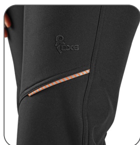
reflexní doplňky reflective accessories elementy odblaskowe