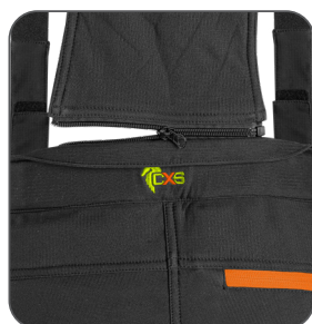
odepínací šle detachable braces odpinane szelki